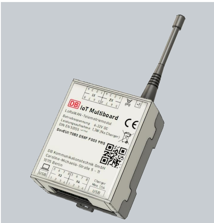
Abbildung 1: IoT Multiboard