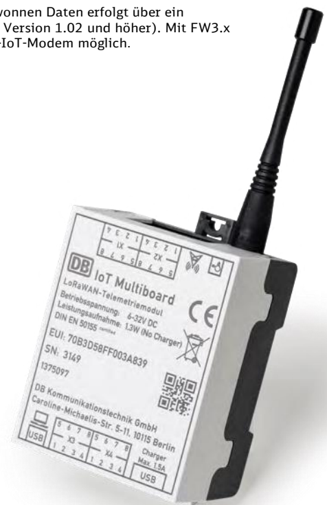
Abb.: IoT Multiboard